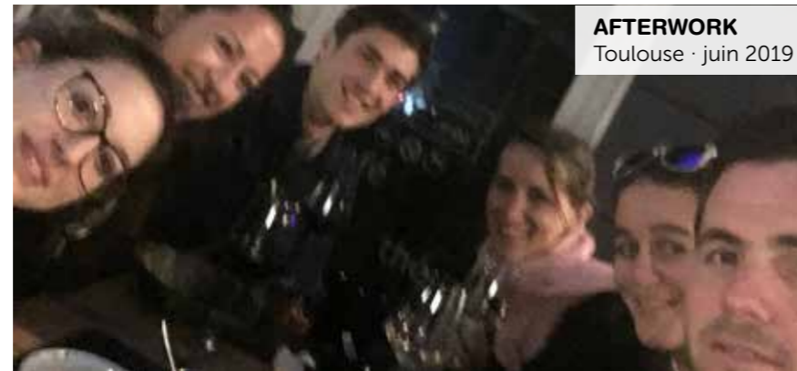
AFTERWORK Toulouse · juin 2019