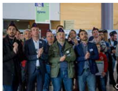
ANIMATIONS PUIS COCKTAIL DANS LE FORUM DE L'EIGSI