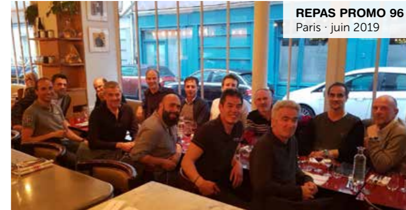
REPAS PROMO 96 Paris · juin 2019