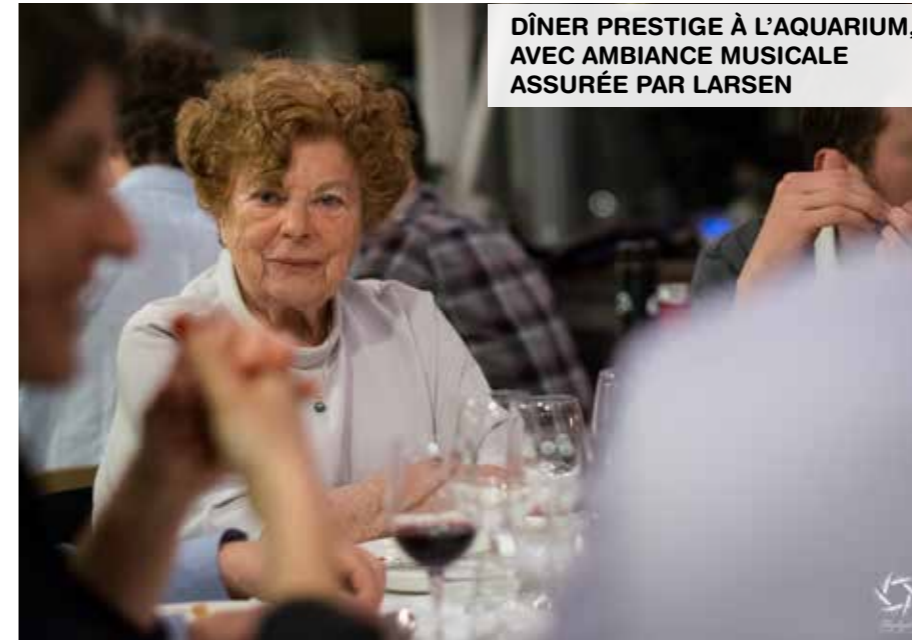
DÎNER PRESTIGE À L'AQUARIUM, AVEC AMBIANCE MUSICALE ASSURÉE PAR LARSEN