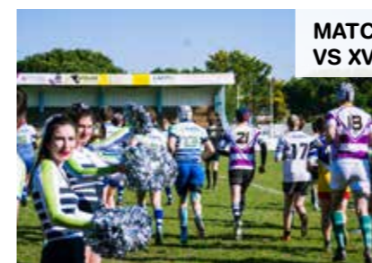
MATCH RUGBY XV ALUMNI VS XV ÉTUDIANTS