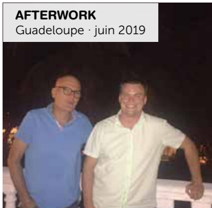
AFTERWORK Guadeloupe · juin 2019