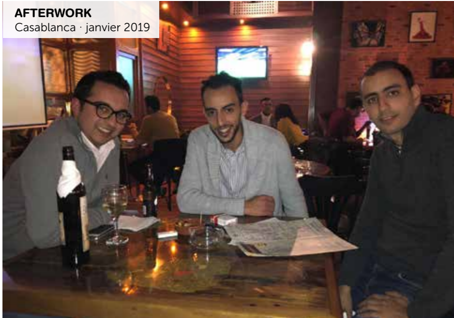
AFTERWORK Casablanca · janvier 2019