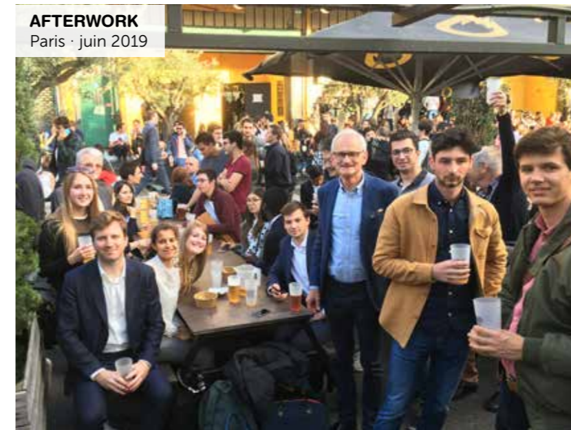
AFTERWORK Paris · juin 2019