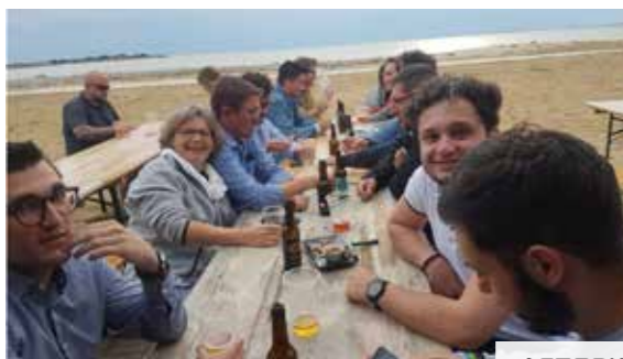
AFTERWORK La Rochelle · juin 2019