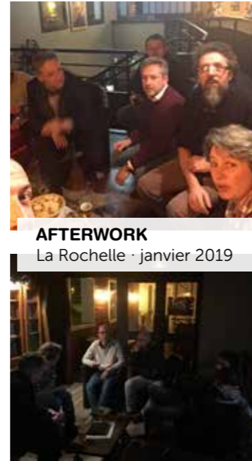
AFTERWORK La Rochelle · janvier 2019