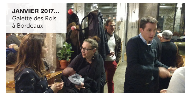
JANVIER 2017... Galette des Rois à Bordeaux