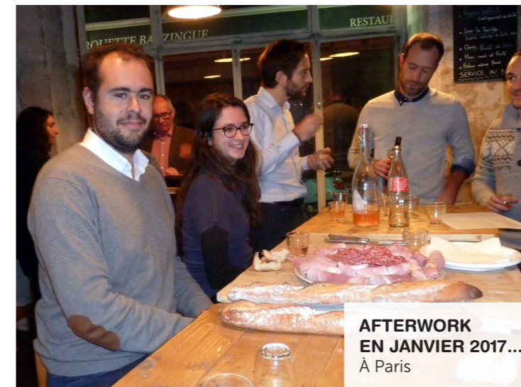
AFTERWORK EN JANVIER 2017... À Paris

f AlumniVioletEIGSI | in Alumni Violet - EEMI - EIGSI - EIGSICA