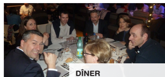
DÎNER sur le bateau L'Espérance, au milieu du vieux Port