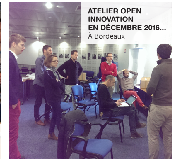
ATELIER OPEN INNOVATION EN DÉCEMBRE 2016... À Bordeaux