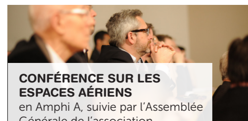
CONFÉRENCE SUR LES ESPACES AÉRIENS en Amphi A, suivie par l'Assemblée Générale de l'association