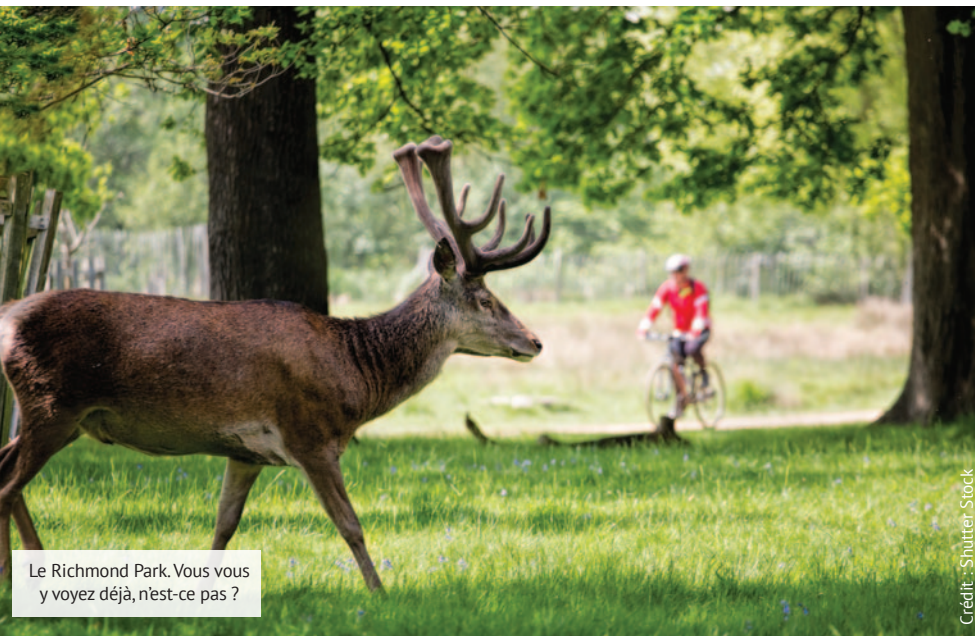
Le Richmond Park. Vous vous y voyez déjà, n'est-ce pas ?