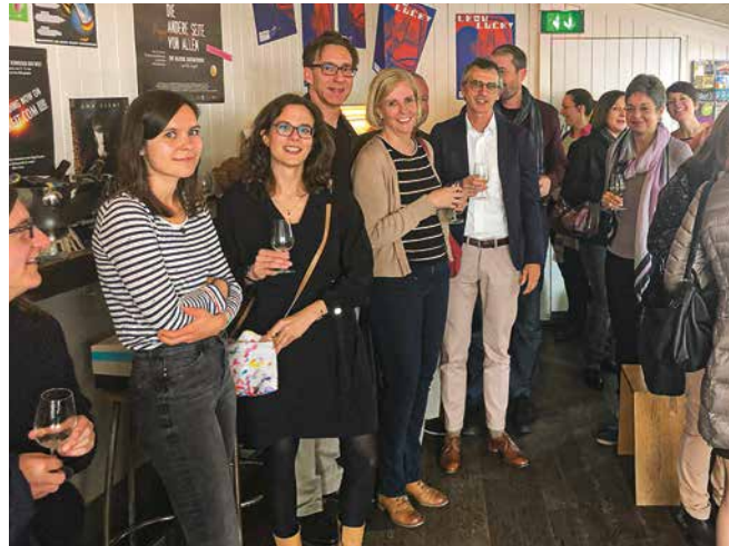
↑ Gründungsfeier des UZH Alumni Chapters VAUZ

Das UZH Alumni Chapter Slavisches Seminar feierte seine Gründung bei einem Podiumsgespräch mit Ehemaligen zum Thema «30 Jahre nach der grossen Wende von 1989 – und was aus uns Alumni geworden ist». Das neue Chapter richtet sich in erster Linie an die Absolventinnen und Absolventen des Slavischen Seminars. Es heisst aber an seinen Veranstaltungen auch Studierende und Interessierte mit einer besonderen Verbindung zum Slavischen Seminar, zu Osteuropa und seiner Geschichte willkommen.