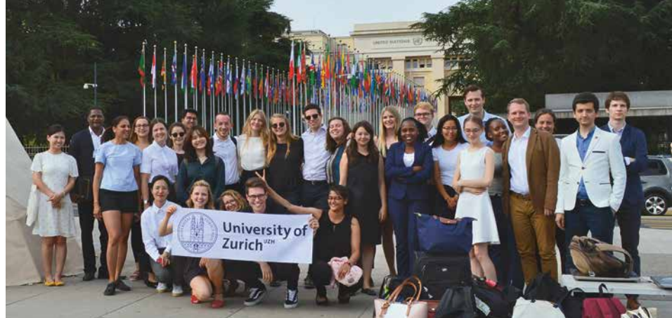
BHRICO Summer School 2019: «Wirtschaft und Menschenrechte». Gruppenbild vor dem Palais des Nations in Genf. Vergabung: CHF 3'000

Akademischer Chor Zürich: «Hexen». Ein Gemeinschaftsprojekt mit dem Akademischen Kammerorchester Zürich. Vergabung: CHF 2'000