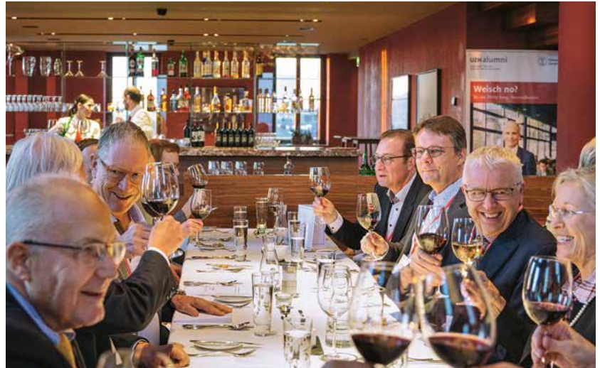
↑ Gemütliches Beisammen- sein im Anschluss an die Generalversammlung im Restaurant UniTurm