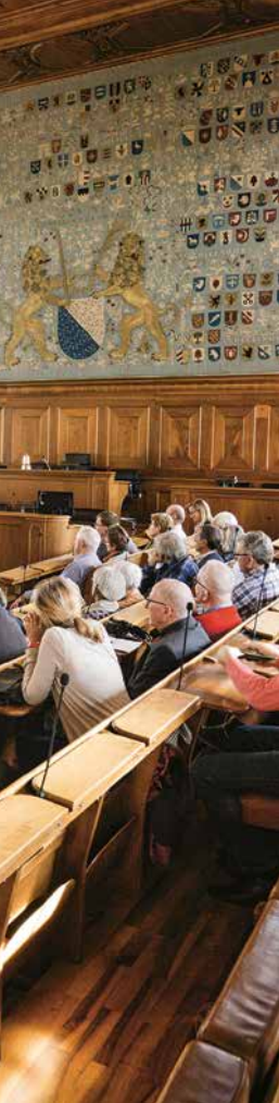
↓ Volle Aula beim Stummfilm mit live Piano-Begleitung