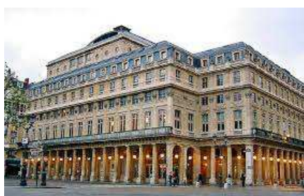
Comédie Française, vue de l'extérieur

Le célèbre théâtre français est le seul, en France, à posséder une troupe permanente de comédiens, la Troupe des Comédiens-Français. Passionné de théâtre ? Amoureux de l'art dramatique ? Simple curieux ? La visite guidée de la Comédie Française est le moment parfait pour en apprendre davantage sur ce lieu incontournable de la culture parisienne. Après un court séjour dans le hall d'entrée, au niveau de la billetterie, le personnel vous guidera dans les coulisses des comédiens, leurs endroits secrets, leur lieu de réunion et, bien entendu, la célèbre salle Richelieu, riche de 862 places assises et de son imposante scène. Laissez-vous conter l'histoire amusante de ce lieu de culture et apprenez en davantage sur ceux qui l'ont bâti et lui permettent encore aujourd'hui de rayonner auprès du public français, et même international !