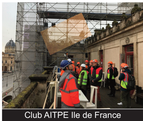
Club AITPE Ile de France