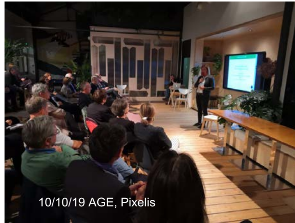
10/10/19 AGE, Pixelis