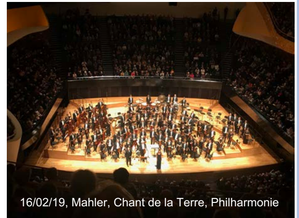
16/02/19, Mahler, Chant de la Terre, Philharmonie