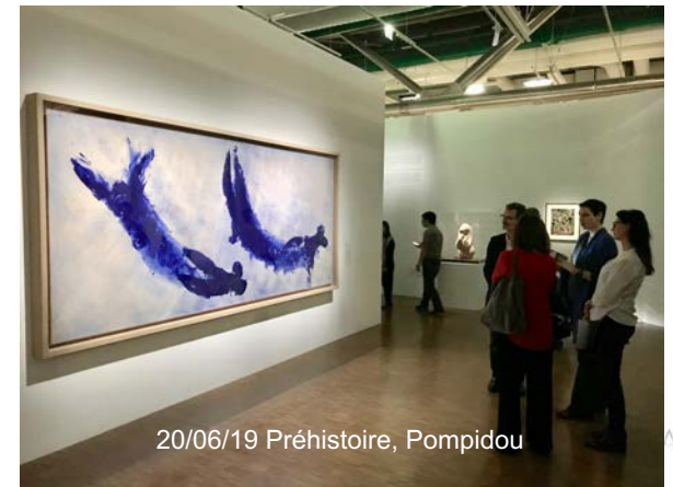
20/06/19 Préhistoire, Pompidou