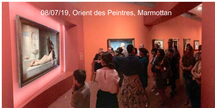
08/07/19, Orient des Peintres, Marmottan