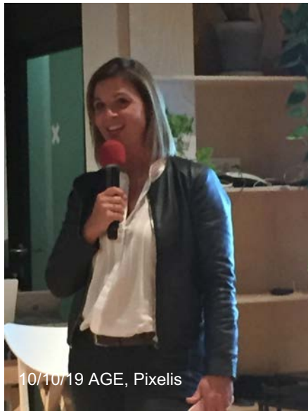
10/10/19 AGE, Pixelis