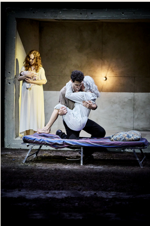
Figure montante du théâtre européen, Mario Banushi invente un langage scénique sans paroles qui tient par la seule force de ses visions. Mami naît d'expériences personnelles, peu à peu transfigurées en un théâtre allégorique, et rend hommage aux figures tutélaires qui ont accompagnées le metteur en scène, dans un poème visuel, un paysage mémoriel que les interprètes traversent pour se confronter à leurs souvenirs et à leur héritage émotionnel, à la fois intimes et universels.

En se demandant, au fond, qui prend soin de qui, Banushi tente de démêler une relation si complexe qu'une vie n'y suffirait pas. Soutenu par un travail visuel, qui exhausse les corps pour les ériger en icônes, l'artiste traduit, au-delà du langage articulé, les émotions contrariées de l'amour filial.